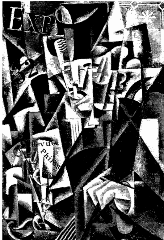
Lyubov Popova, Portrait of a Philosopher, 1915

ον, ο μαρξισμός έχει να κάνει με αντικείμενα, τα οποία αναπτύσσονται από μόνα τους (με τη φύση, με την κοινωνία...), και τα οποία αναπαριστά ως αναπτυσσόμενα.